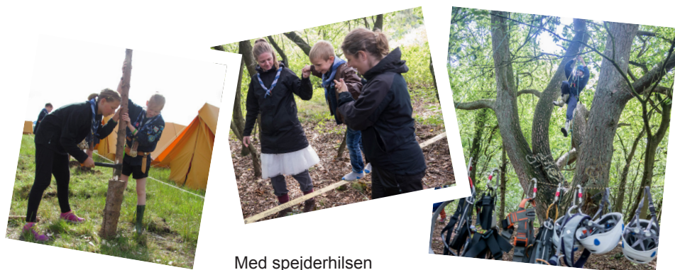
Med spejderhilsen Frie Fugle

På gruppens hjemmeside kan du melde dig ind i gruppen. Ved indmeldelse betales første kontingent rate med dankort. Se mere på: frie-fugle.dk/indmeldelse .